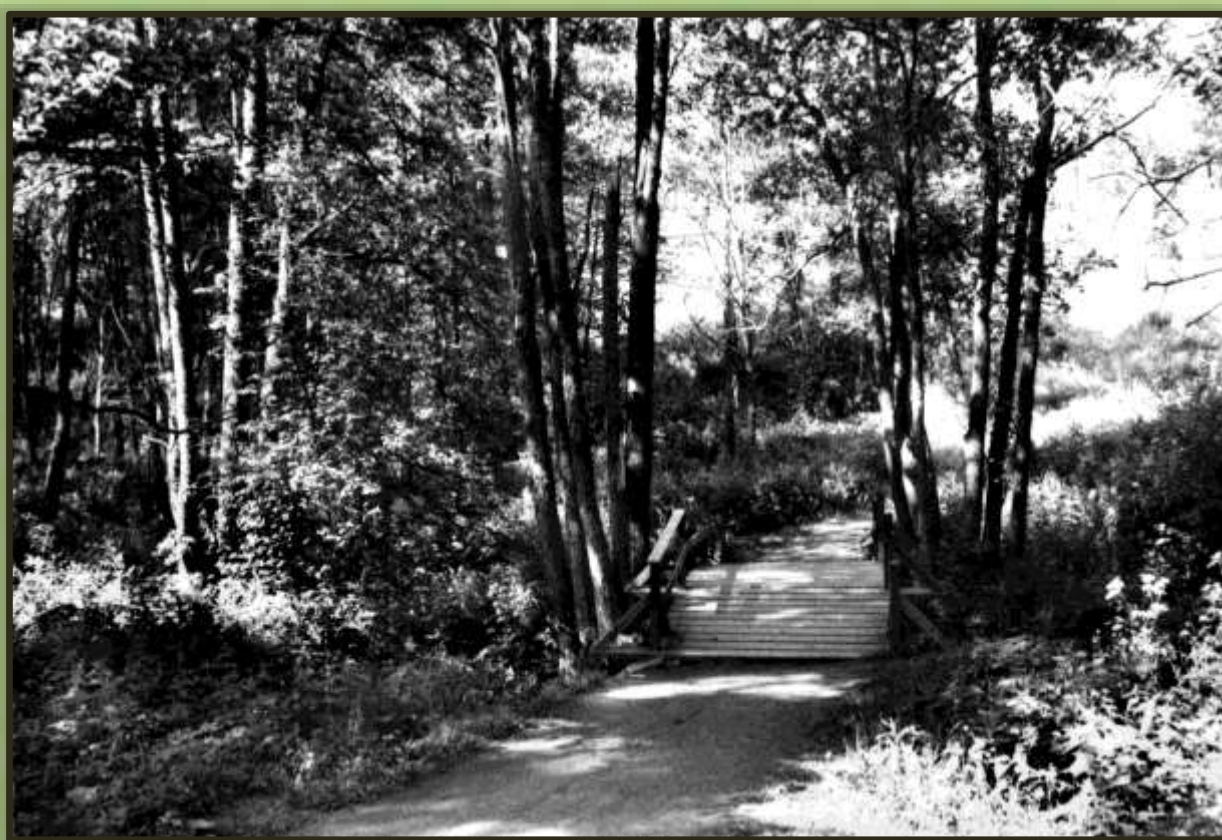
Motiv från Ryrbäcken i juni 1989.

Artikel i Tidningen Trollhättan 21 april 1955 med bilder från Innovatums bildarkiv.