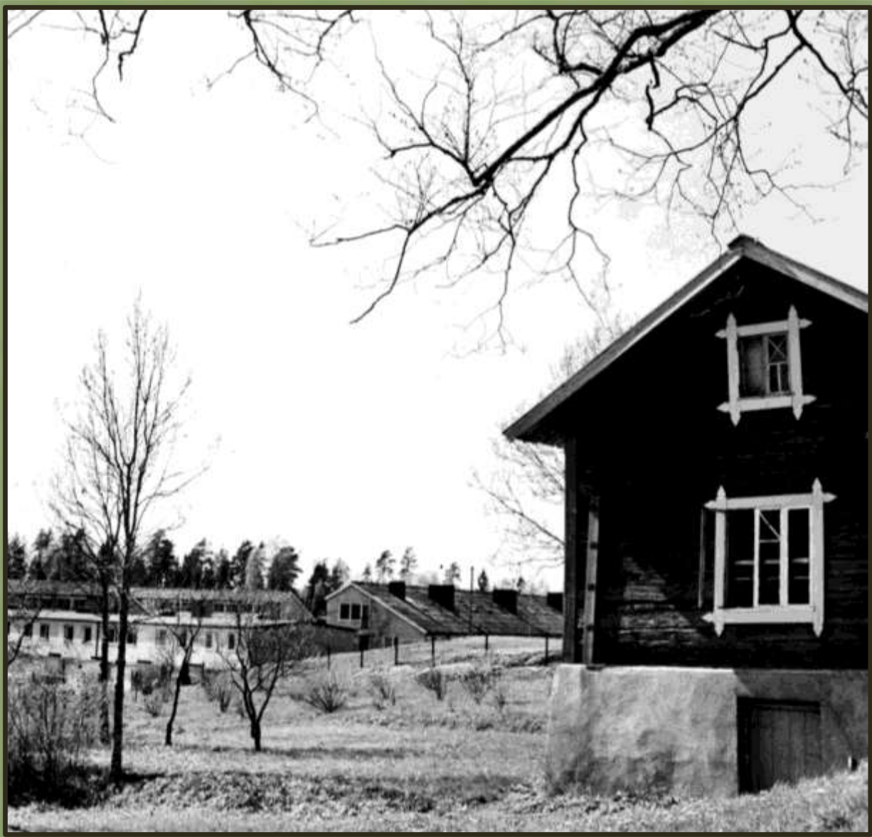
Ryrs gård och radhusen vid Bergkullevägen. Foto av Ulf Gertz år 1965.