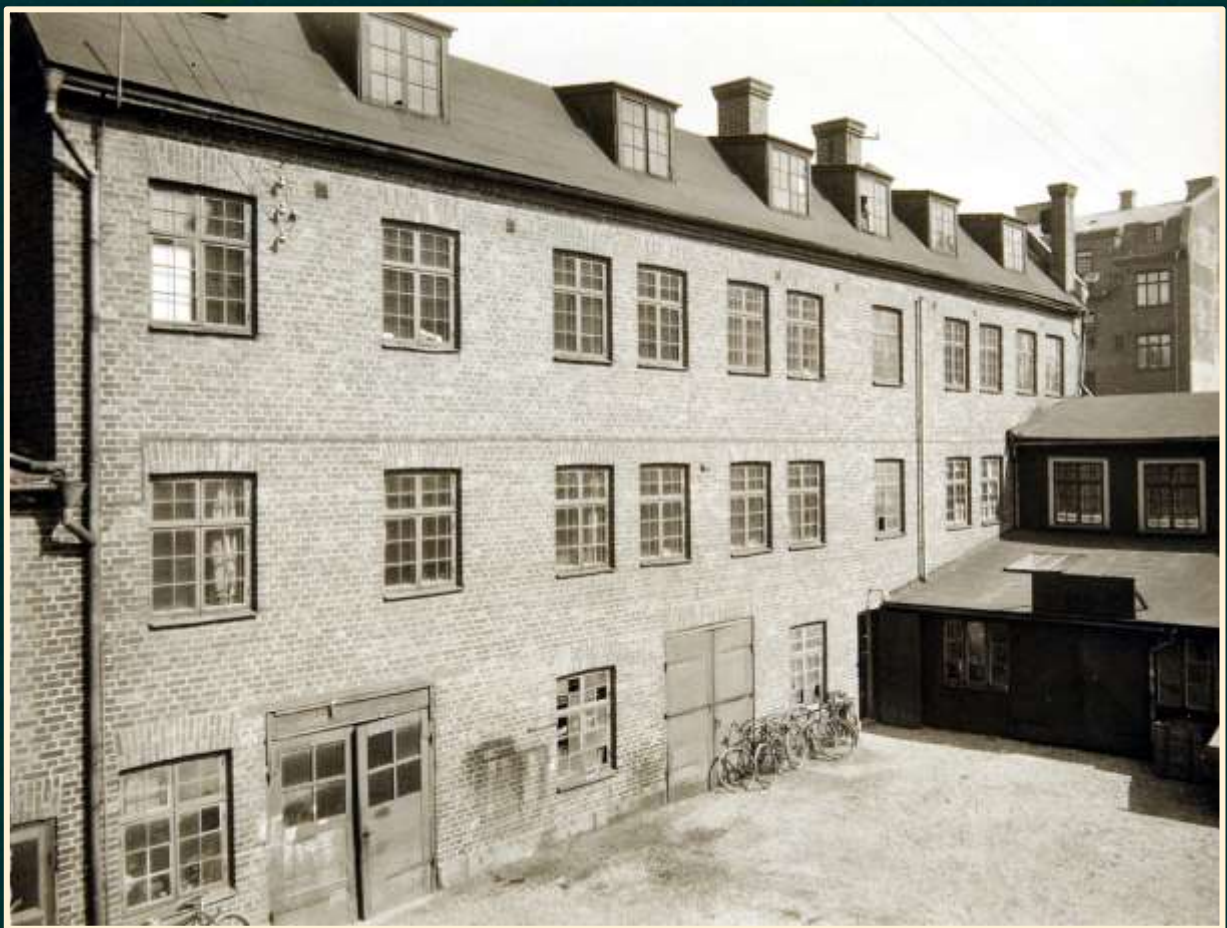
Kungsgatan 22 med Helmer Ekmans kartongfabrik inne på gården.

Den blygsamma lilla framgången med den första radioutsändningen sporrade emellertid till nya tag. Det gällde att handla och att handla snabbt. I en av mig förhyrd lokal i gårdshuset Kungsgatan 22, "Och-huset" som det i dagligt tal kallades, avdelades ett utrymme för en sändarstation, en radiomast restes på gaveln till samma hus och en annan mast på gaveln till ett närliggande hörnhus vid Drottninggatan, en sändarantenn monterades och hissades upp och ett solfjädersformat balansnät spändes ut över en mellanliggande tomt. Sändaren utbyggdes och förbättrades på basis av de erfarenheter som gjorts. Från en ackumulatorfabrik inköptes fyrahundra stycken glasackumulatorer som seriekopplades, och vars kapacitet möjliggjorde övergång till tvåhundrafemtio watts oscillator- och modulatorrör. Sändarens fältstyrka ökade härigenom avsevärt till lyssnarnas glädje och belåtenhet.