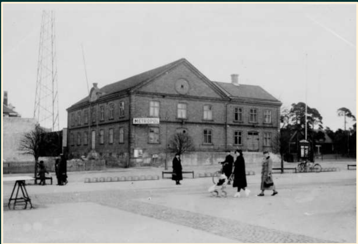
IOGT:huset i kvarteret Tor vid Föreningsgatan med radiomasten i bakgrunden.