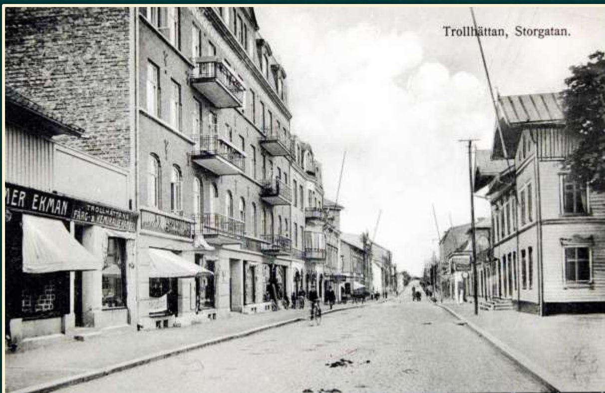
Storgatan år 1921. Vänersborgsbanken höll till i huset närmast till höger.