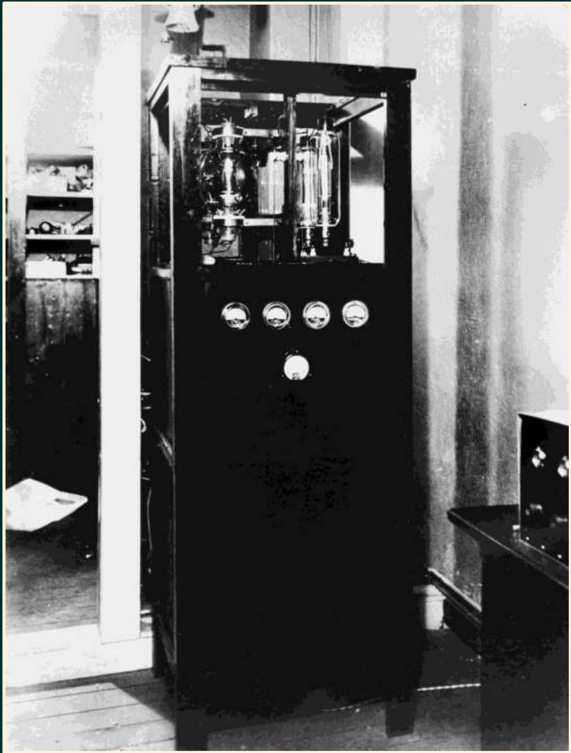
Trollhättans Rundradio på 1920-talet.