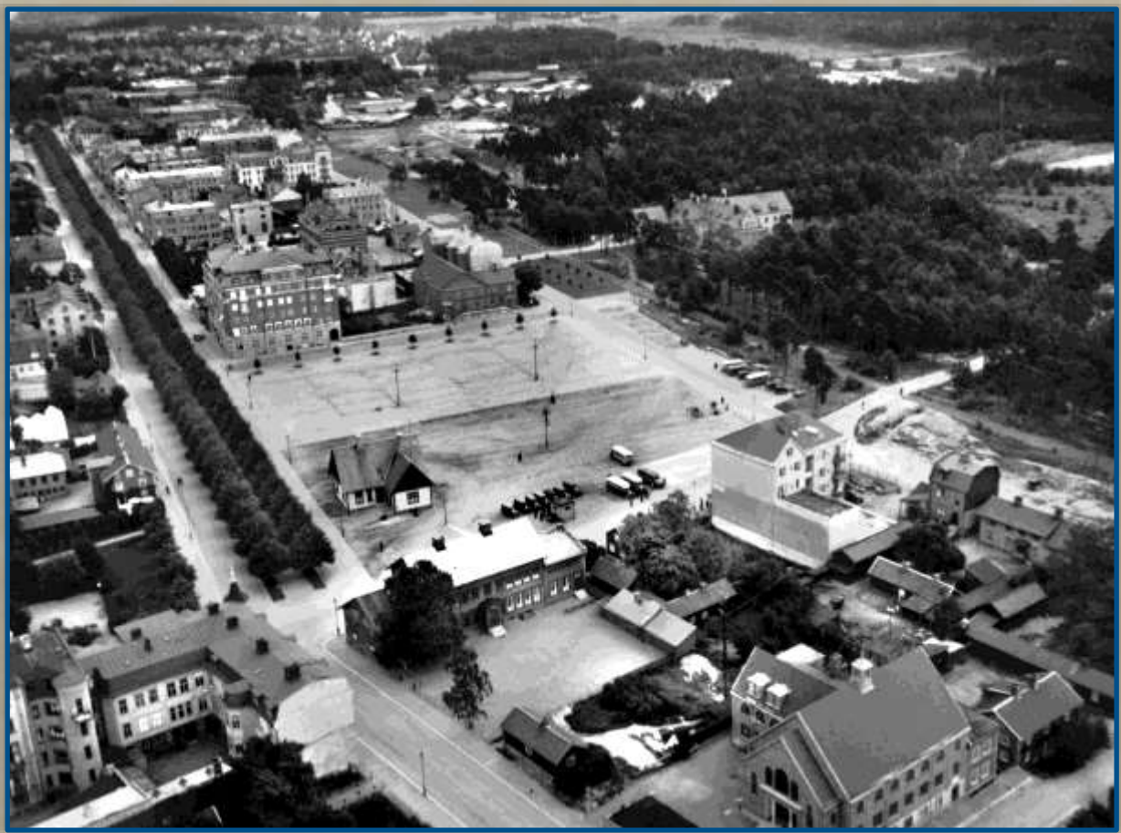
Drottningtorget med omnejd innan nya tingshuset. Foto år 1933.