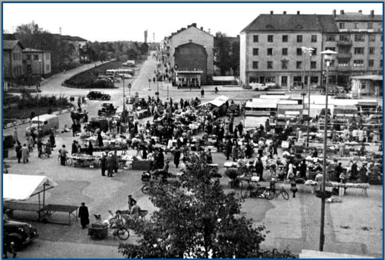
Drottningtorget med tingshuset till vänster vid Drottninggatan. Foto år 1950.