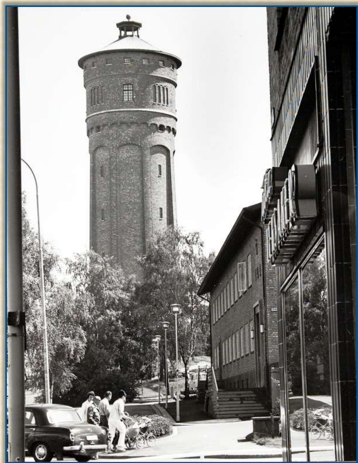
Ett öppet fönster i tingshusets andra våning.