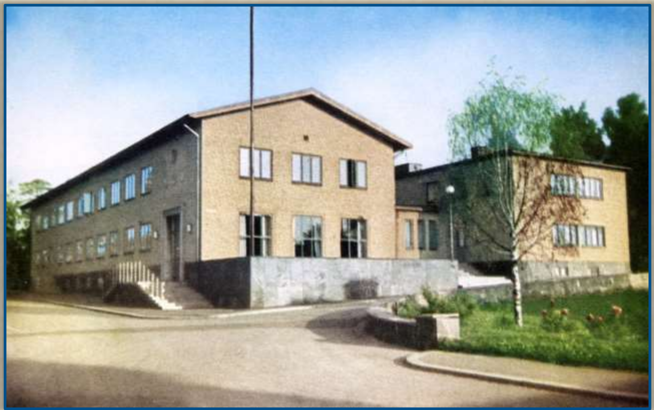
Flundre, Väne och Bjärke häraders tingshus.

Artiklar i Tidningen Trollhättan 1938 och 1955 med bilder från Innovatums bildarkiv.