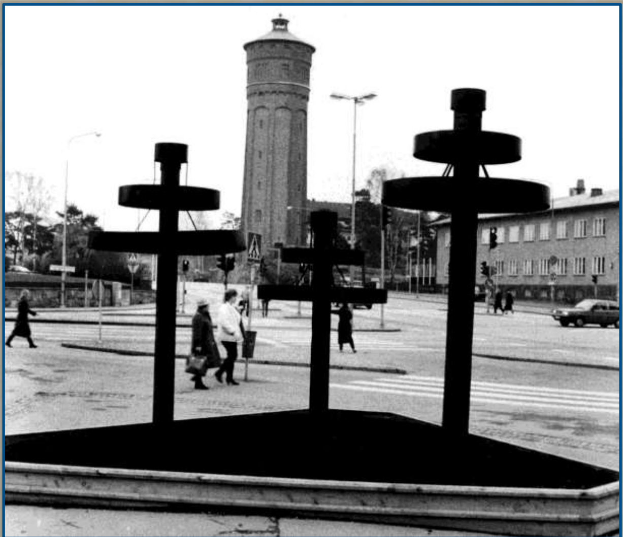
Drottningtorget med tingshuset till höger vid Gärdhemsvägen. Foto år 1983.