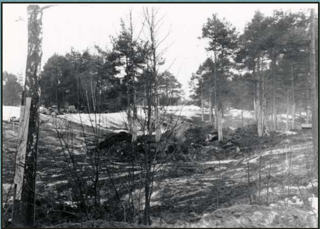
Sprängning för tekniska läroverket i mars 1960.

Ansökningstiden för inträde till tekniska läroverket utgår den 31 juli och i början av augusti ska eleverna tas ut. Som nämnts har redan många anmälningar lämnats in. Dessutom går 15-20 elever i den förberedande kursen som pågår vid yrkesskolan, dessa kommer givetvis också att söka till läroverket.