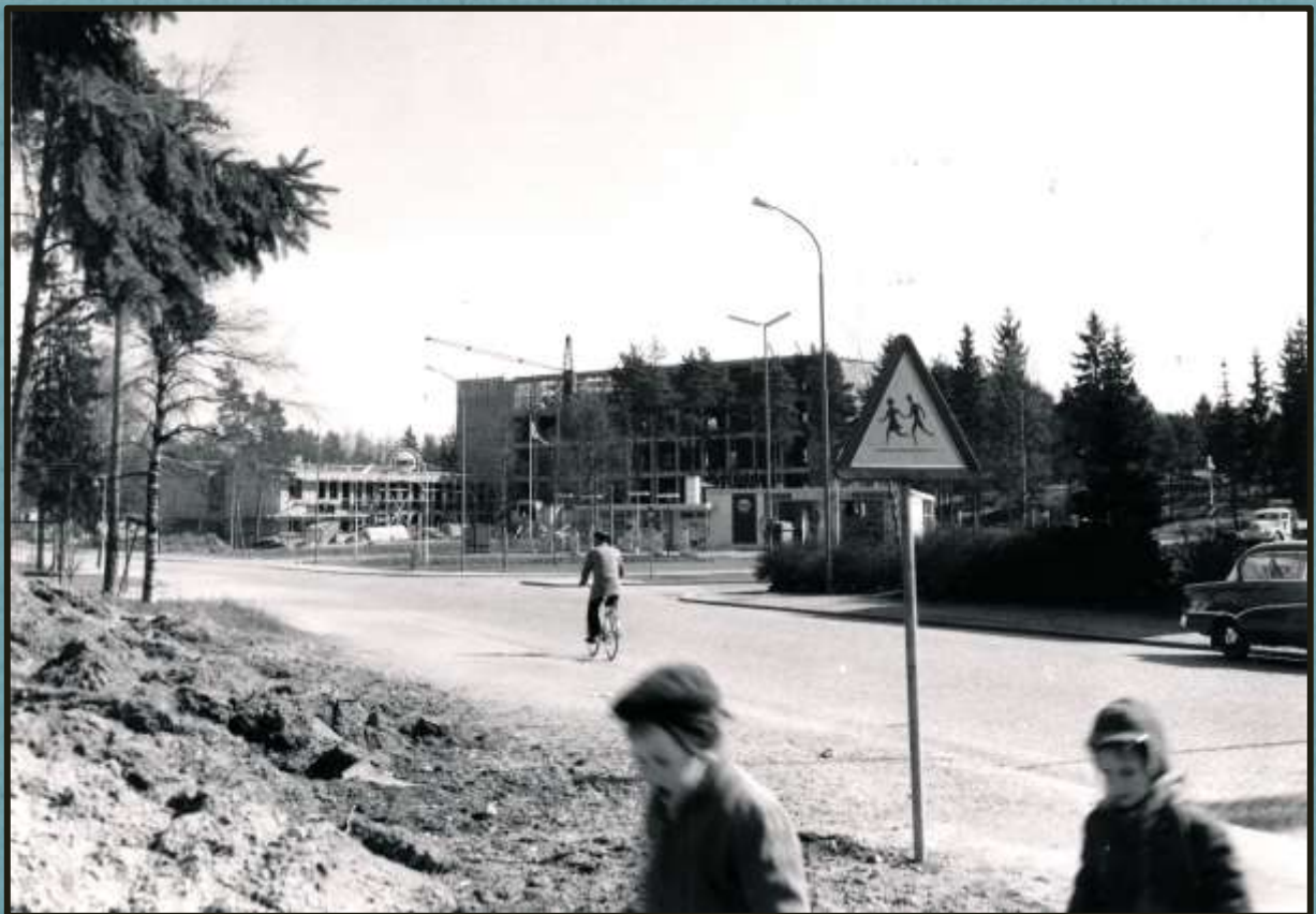
Bygget av det som senare skulle kallas Nils Ericsonsskolan i april 1960.

En del av de anmälda är redan klara att få börja, medan andra åter kommer att mycket noggrant vägas mot varandra – betygspoäng gäller nämligen – och andra åter kommer att få tentera mellan den tjugonde och tjugosjätte augusti. Först på uppsprogsdagen den första september är den definitiva elevintagningen klar.