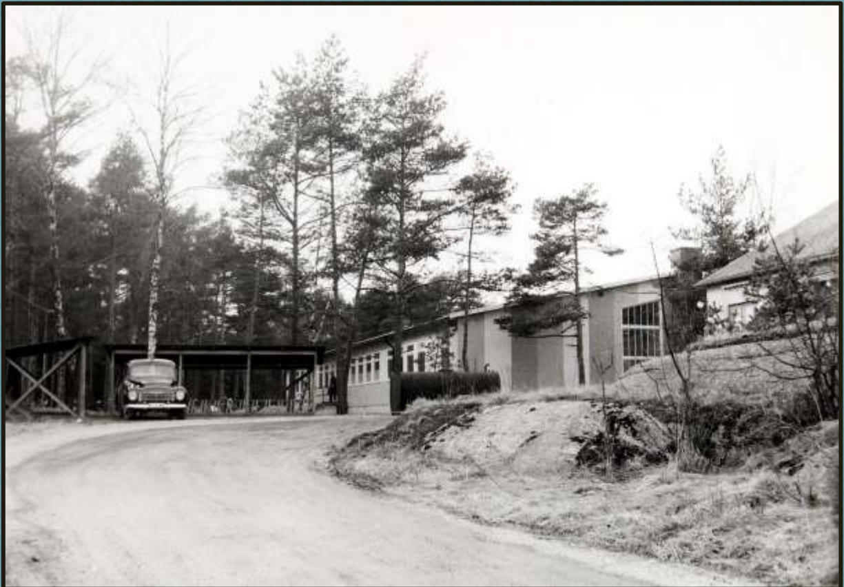
Provisorisk lokal för tekniska gymnasiet i kvarteret Elefanten vid Tingvallavägen. Foto år 1961.