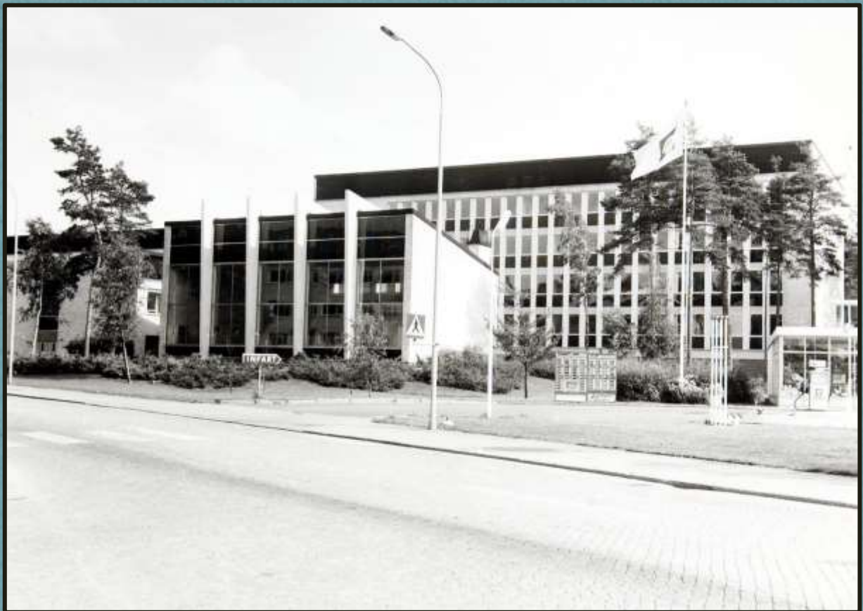
Nils Ericsonsskolan i kvarteret Bolagskvarten. Båda foton av Sven Stertman år 1965.