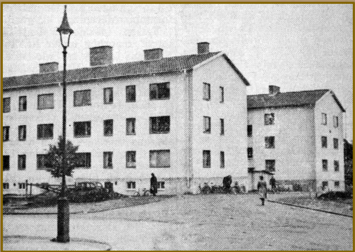
HSB-fastigheterna i kvarteret Lejonet vid Stridsbergsgatan.

Bland övriga avslutade storbyggen märks den nya HSB-fastigheten i kvarteret Lejonet uppförd av AB Skånska Cement. Även i detta fall rör det sig om en byggnad av lamellhustyp, uppförd i anslutning till de fastigheter som under föregående år blev färdiga på området.