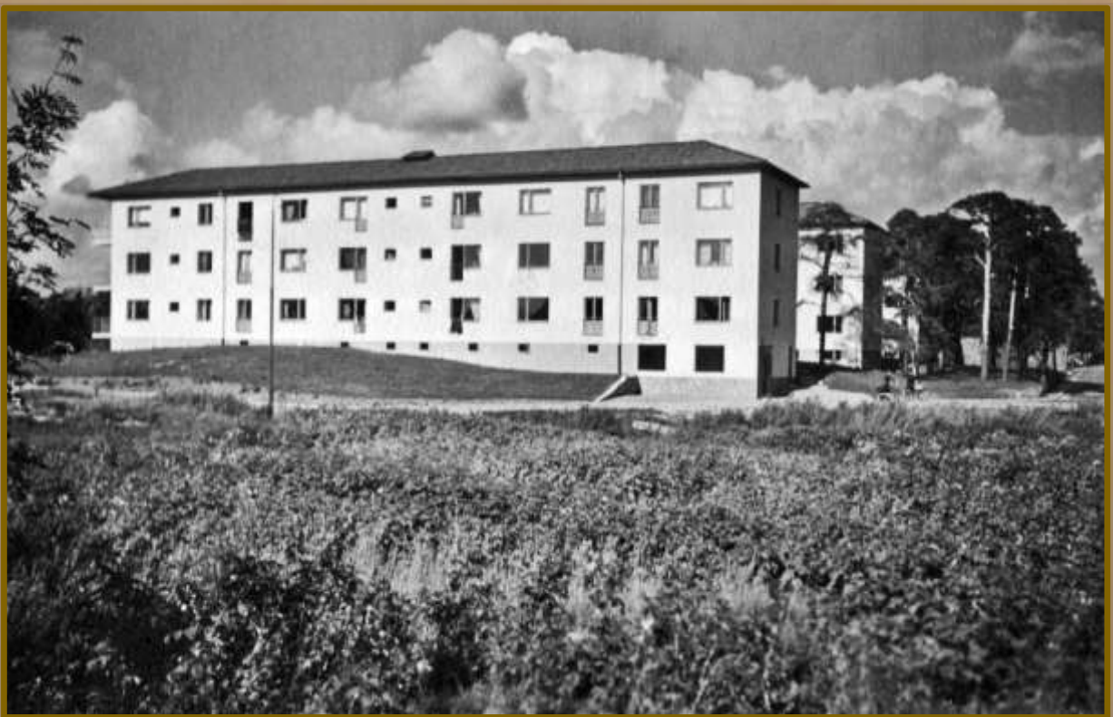
Kvarteret Älvkvarnen vid Domsagevägen.

Någon direkt stagnation i byggnadsverksamheten kan man emellertid icke tala om. Trots de försvårade förhållandena har det byggts ganska livligt under det senaste halvåret och betydligt över hundratalet nya lägenheter stod som tidigare omnämnts färdiga att tagas i bruk vid flyttningsdagen första april. Staden har också fortsatt att växa ut i det att områden som tidigare varit fria från bebyggelse tagits i anspråk för större eller mindre fastigheter och den utveckling som på detta sätt trots krisen fortgått har varit till stor båtnad både för bebyggelsens centralisation samt stadens utseende.