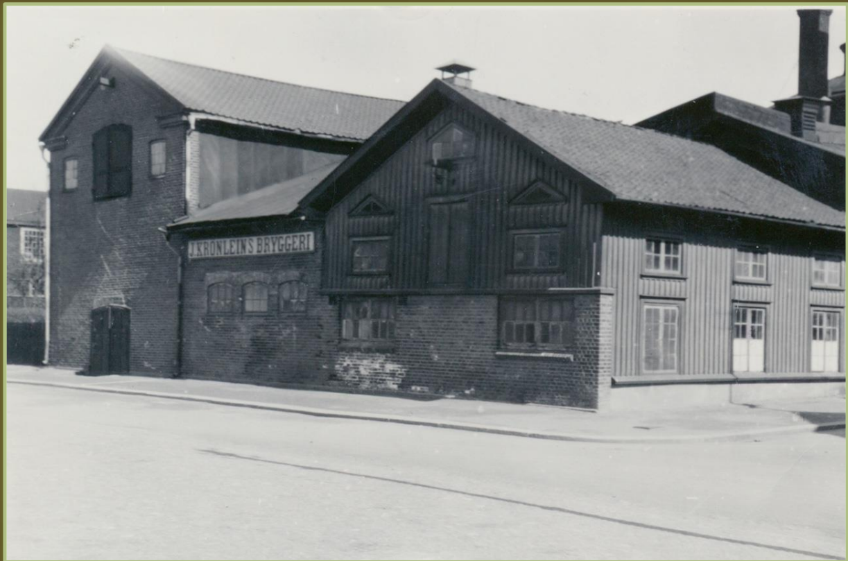
Bryggeribyggnaderna i kvarteret Bore i hörnet av Strandgatan och Föreningsgatan år 1929. Till vänster på den undre bilden Hellströms bryggeri som stod färdigt 1870. Mellanbyggnaden med Krönleins skylt och trähuset i hörnet byggdes år 1877. Hemgrens bryggeri, färdigt 1843 lär ha legat delvis på tomten och delvis på trottoaren. Där fanns också en stor vattendamm med öppning mot älven. Text och bilder från Innovatums bildarkiv.