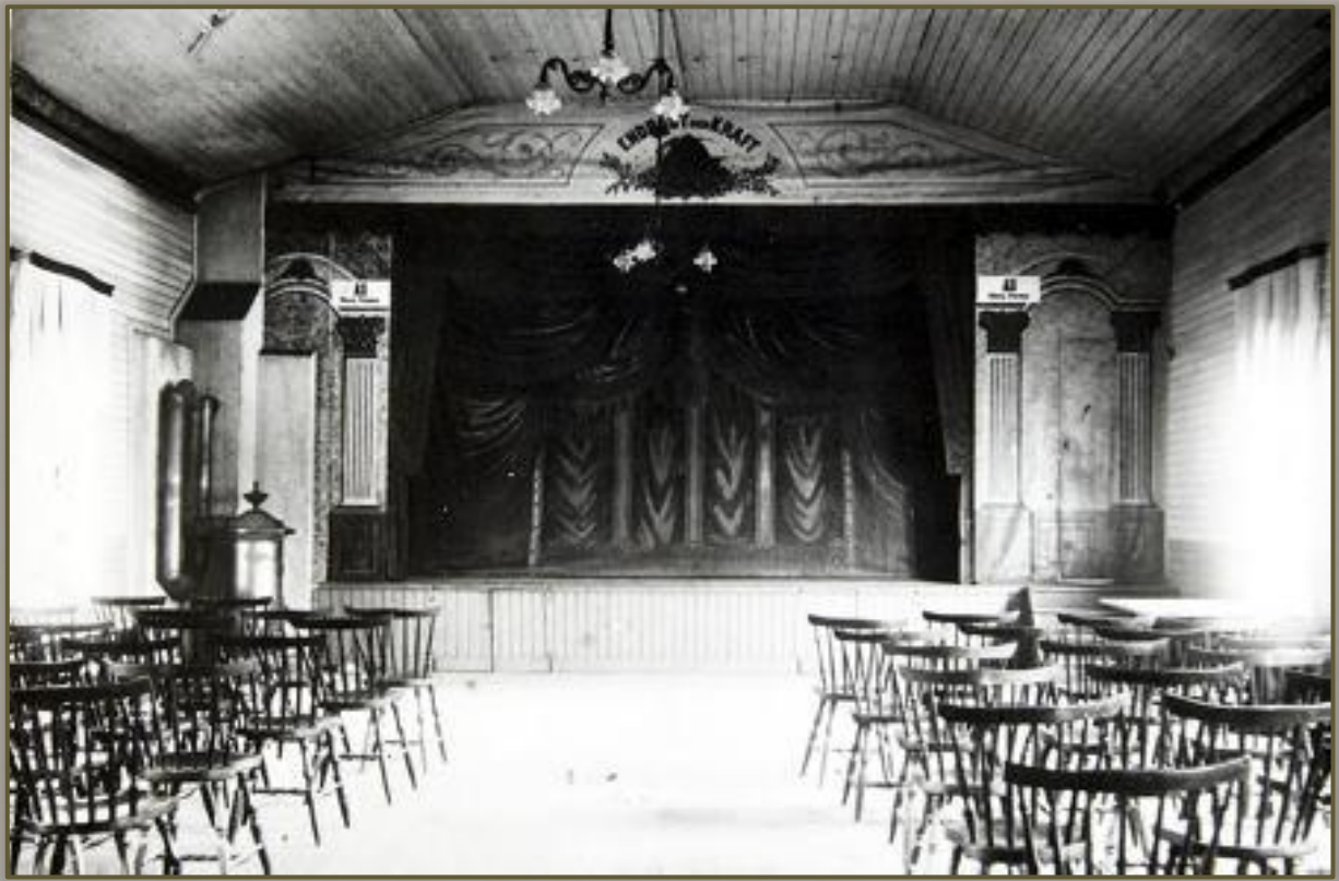
Samlingssalen i Arbetareföreningens hus.

Älven fryser till. Galeasen Anna på väg till skeppsdockan blir infrusen vid tändsticksfabriken.