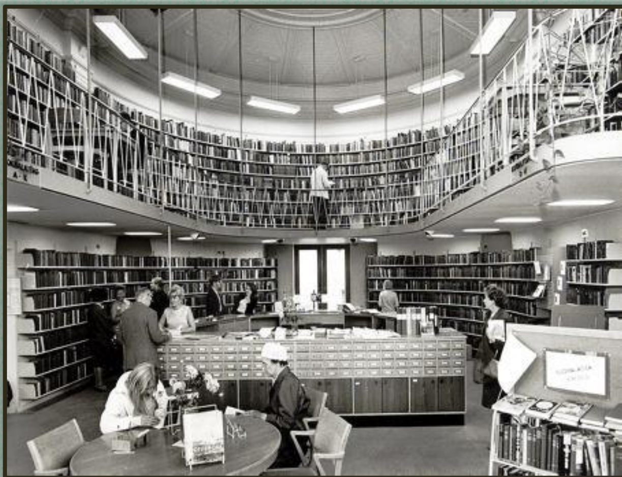
Stadsbiblioteket i gamla tingshuset. Foto Sven Stertman 1967.

En riktig högtidsstund var det när jag skickades ner till vuxenavdelningen i något ärende. Det hände inte särskilt ofta de första åren, eftersom man egentligen inte fick gå dit förrän man fyllt tretton år.