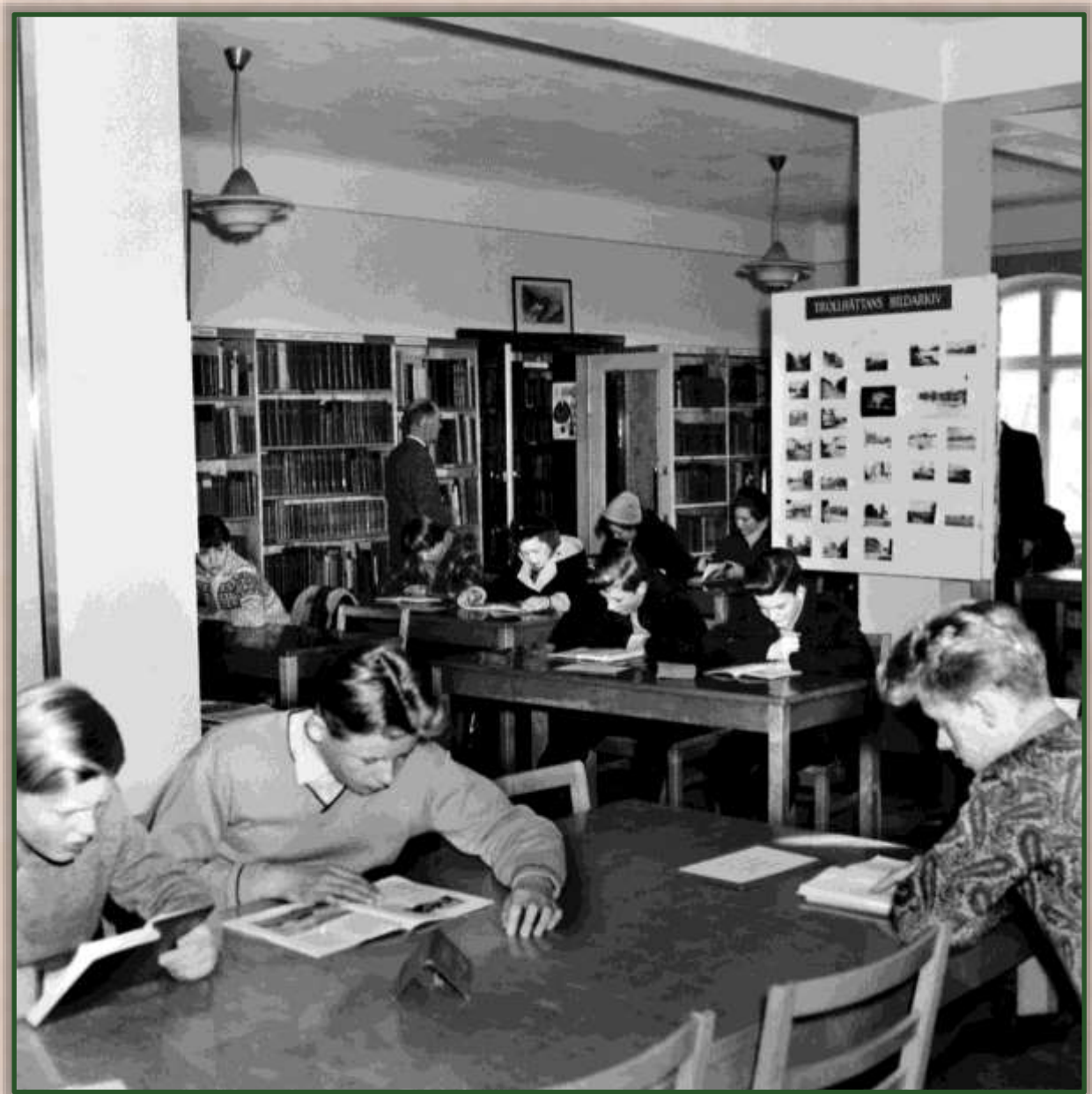
Stadsbibliotekets läsesal i mars 1955.

gamla salen äro nämligen litet väl mörka. Emellertid har så pass mycket vunnits genom flyttningen att man inte får vara för kritisk. Hyllorna stå nu lätt åtkomliga och någon trängsel torde ej behöva befaras även om frekvensen blir livlig. Dessutom har salen en sådan höjd att man i framtiden lätt kan förse den med läktare eller dylikt som ytterligare kunna öka utrymmet.