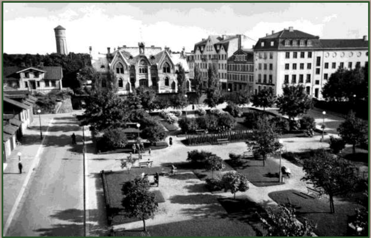
Karl Johans torg år 1931 med tingshuset i bakgrunden.