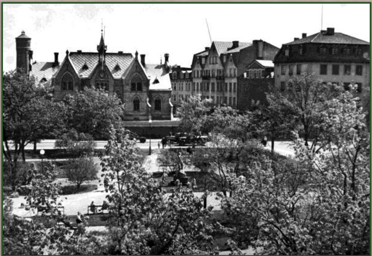
Karl Johans torg år 1946 med stadsbiblioteket i bakgrunden.

Allmänhetens intresse för biblioteket är synnerligen stort för närvarande, framhålls det. Man torde också kunna hoppas på en alltjämt stigande frekvens då nu biblioteket erhållit både rymligare och mera lättillgängliga lokaler.