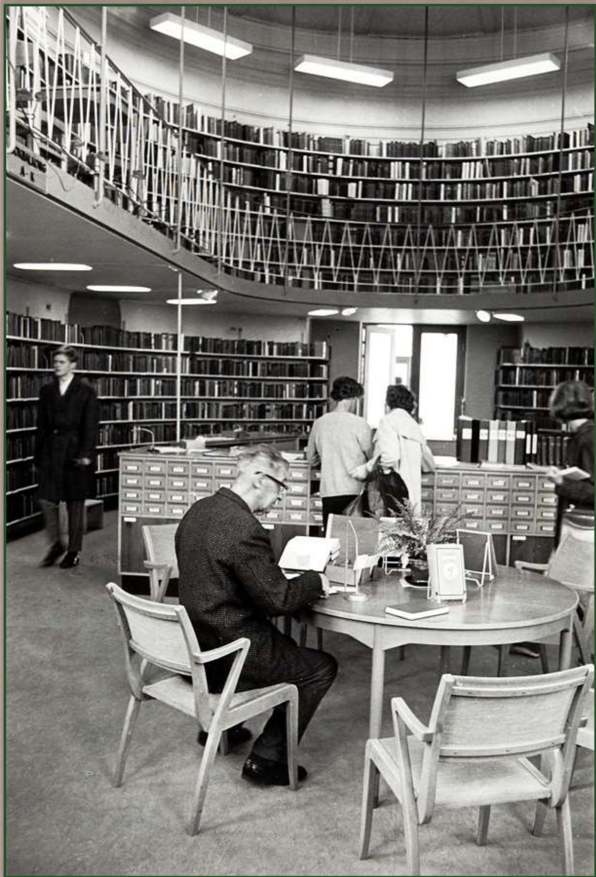
Stadsbiblioteket i gamla tingshuset.