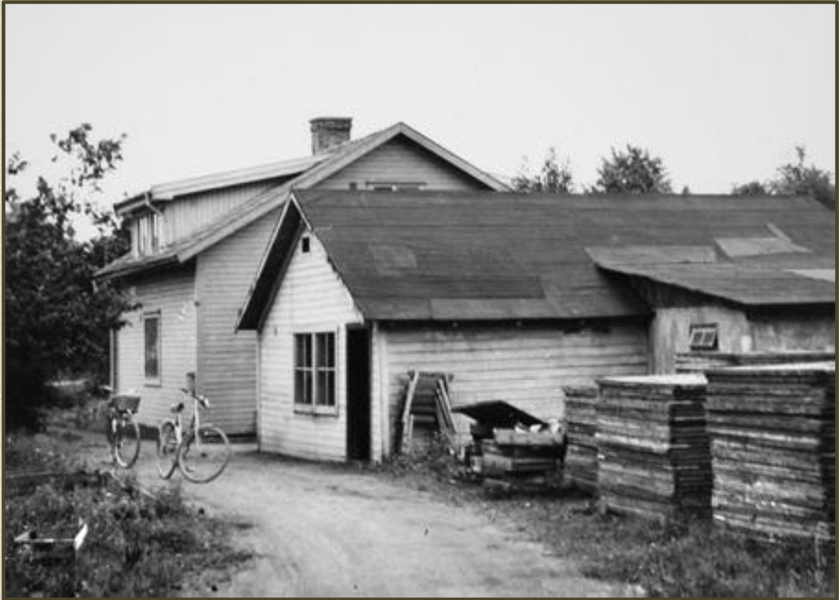
Trädgårdsmästare Anderssons bostad i kvarteret Inspektoren. Foto år 1959.