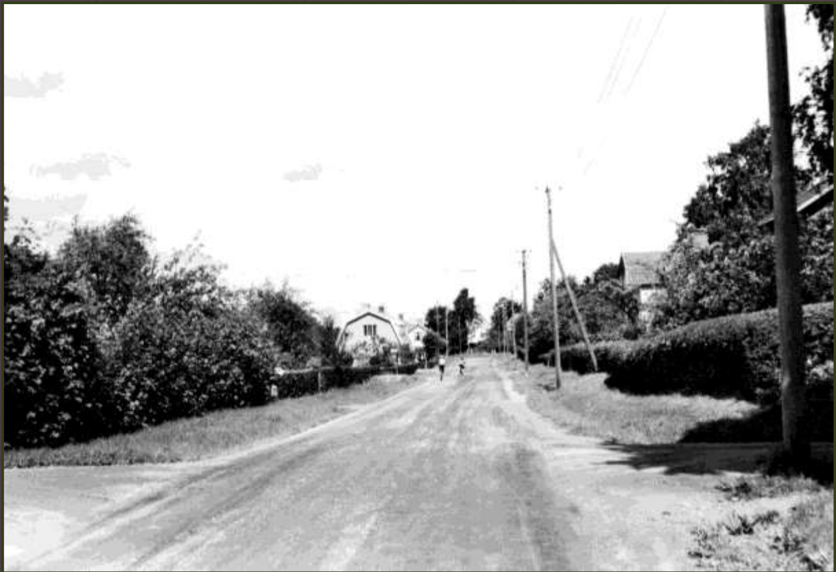
Albertsvägen vid kvarteret Midgård år 1953.

Att köra jord från ett ställe för att få plats med skärv som hämtats från ett annat kanske verkar litet sökt, men det är faktiskt vad som just nu försiggår på den så kallade Albertsvägen i Strömslund. Det underliga beteendet är ett led i vägförbättrandet inom Trollhättan och resultatet kommer att bli en splitter ny vägsträcka från Källstorp svägen i närheten av före detta Kristallsalongen till Kungälvsvägen.