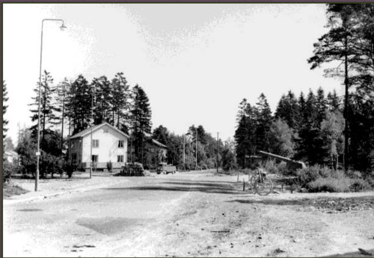
Gärdhemsvägen österut från Mjölnaregatan i augusti 1958.