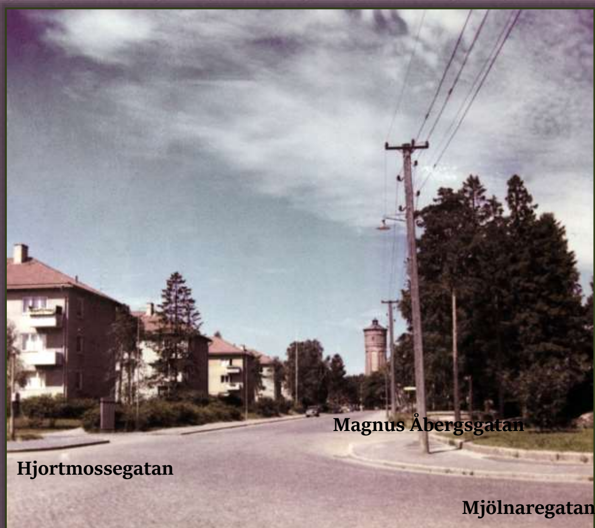
Gärdhemsvägen mot vattentornet, vid korsningen Hjortmossegatan, Mjöltnaregatan och Magnus Åbergsgatan. Foto i juli 1959.

ningen av Gärdhemsvägen, som varit ett länge uttalat önskemål. Gärdhemsvägen på sträckan från vattentornet till Mjöltnaregatan har ju, som alla trafikanter känner till, varit extraordinärt usel med stora gropar i vägbanan och utan gångbanor för fotgängarna. Nu har man äntligen startat stensättningen av vägen och ett tiotal man kommer att hålla på med arbetet i ungefär en månads tid. Gångbanor på bägge sidor anlägges också. Ett anslag på 50 000 kronor har ställts till förfogande för att man skall kunna sätta vägen i gott skick. Medan stensättningen pågår dirigeras trafiken om över tingvallaområdet. Förutom dessa omfattande vägarbeten håller man också på med mindre vägförbättringar litet varstans inom staden, så nu lär det snart vara hopplöst för vägkverulanterna att komma till tals.